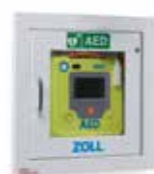
Vollständig eingelassener Wandschrank Artikelnr. 8000-001258