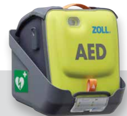
Universal-Wandhalterung mit ZOLL AED 3, Tragekoffer und Reservesatz CPR Uni-padz (in Tragekoffer) Artikelnr. 8000-001266