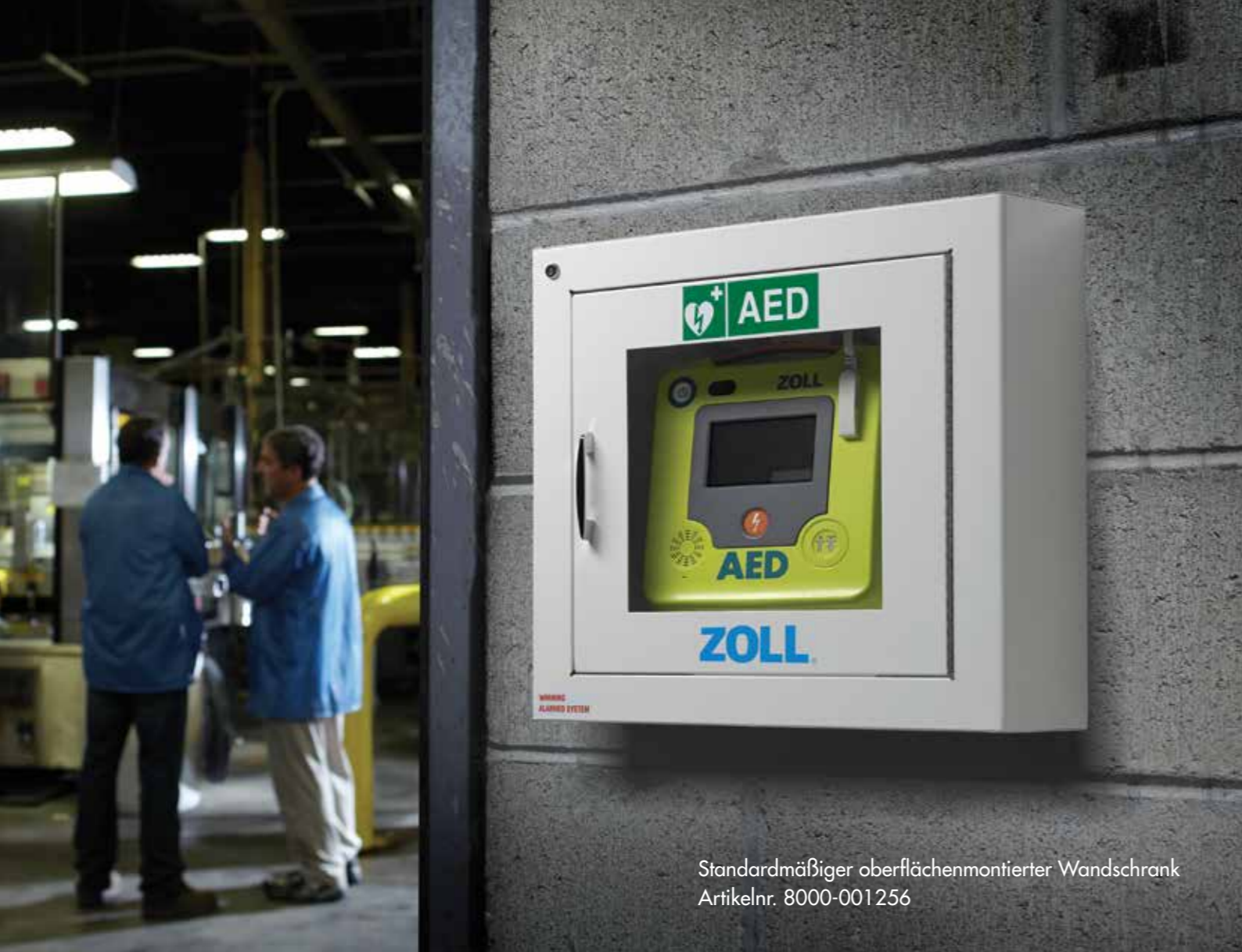
Standardmäßiger oberflächenmontierter Wandschrank Artikelnr. 8000-001256