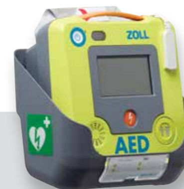
Universal-Wandhalterung mit ZOLL AED 3 alleine (ohne Tragetasche) Artikelnr. 8000-001255

Die Universal-Wandhalterung bietet Platz für den ZOLL AED 3 ohne oder mit seinem Tragekoffer und ist mit dem grünen ILCOR AED-Symbol versehen. Enthält Befestigungsmaterialien, eine Karte für die Kontrolle von Verbrauchsartikeln, eine Wandhalterungsvorlage sowie eine Installationsanleitung.