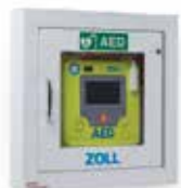
Halb eingelassener Wandschrank Artikelnr. 8000-001257

Wählen Sie das oberflächenmontierte Modell für den einfachen Einbau, das halb eingelassene oder das vollständig eingelassene Modell für die diskretere Aufbewahrung. Alle drei Modelle beinhalten ein ILCOR (International Liaison Committee on Resuscitation) AED-Beschriftungsset sowie eine Installationsanleitung.